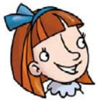
• das Mädchen