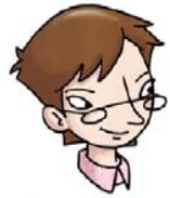
• die Lehrerin